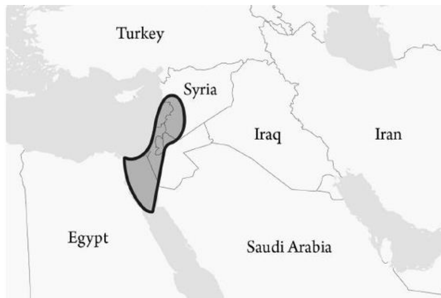
Fig. p. 28 Harta teritoriului promis propriu-zis

În diversele pasaje care detaliază granițele țării promise, sunt unele puncte de referință asupra cărora nu putem fi siguri în totalitate, dar parametrii generali sunt relativ clari. Și, deși cei mai mulți cred că „țara promisă“ include doar prezentul Israel modern, adevărul este că promisiunea includea și o parte însemnată din Deșertul Sinai, mare parte din actualul Liban, o bucată însemnată din sudul Siriei, mare parte din Iordania, toate înălțimile Golan, precum și West Bank și Gaza.